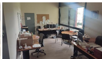
RDC du bâtiment A